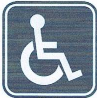
สัญลักษณ์ผู้พิการ